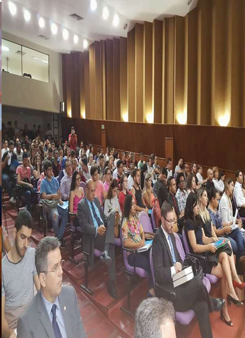
Atividade de extensão