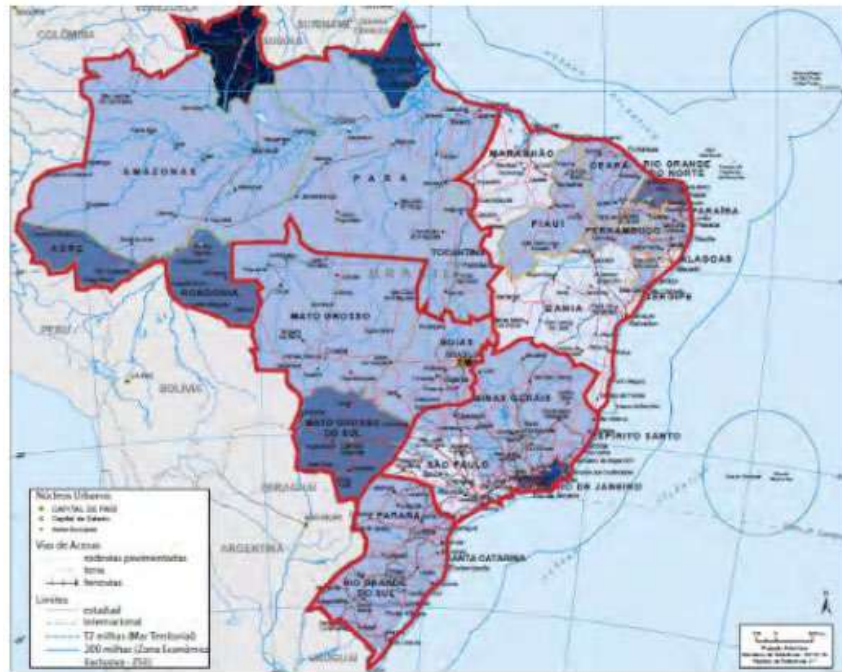
Figura 2 – Densidade de Servidores Federais por 100 mil habitantes – Mapa em 2016